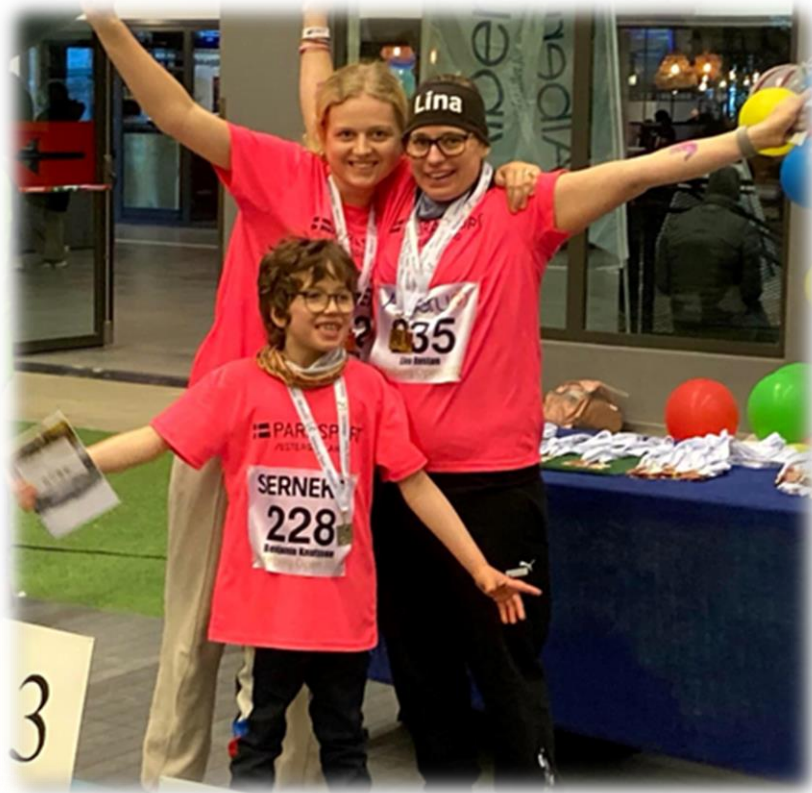
Prisutdelning vid Göteborg Open 2022