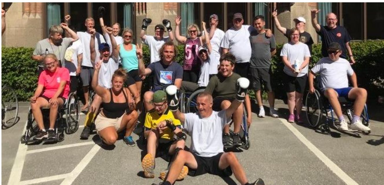
Foto: Blåklintens läger på besök för att prova olika parasporter